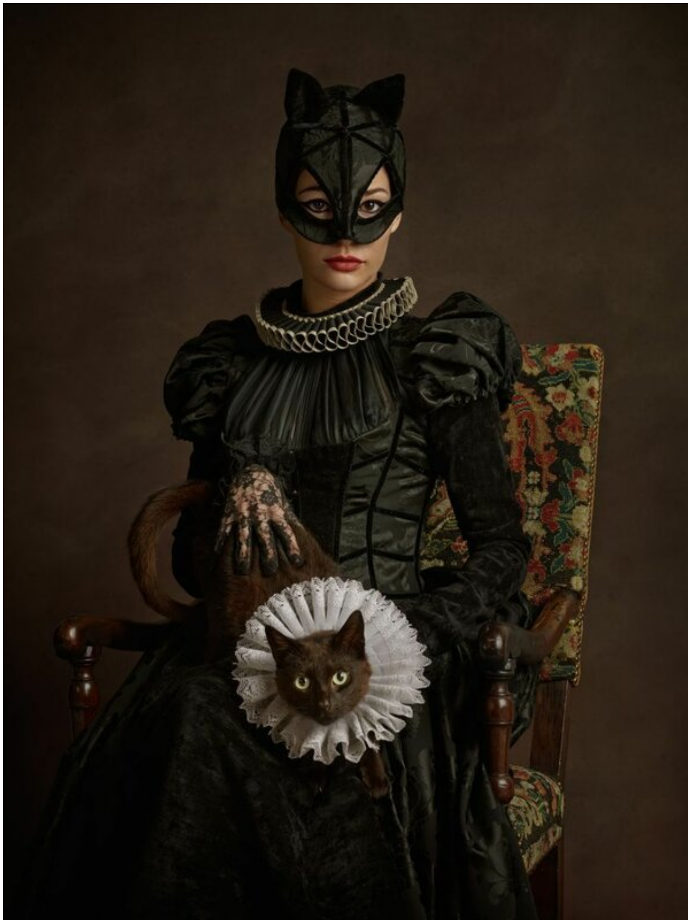
Historical "eslibydakabyzm" Sacha Goldberger