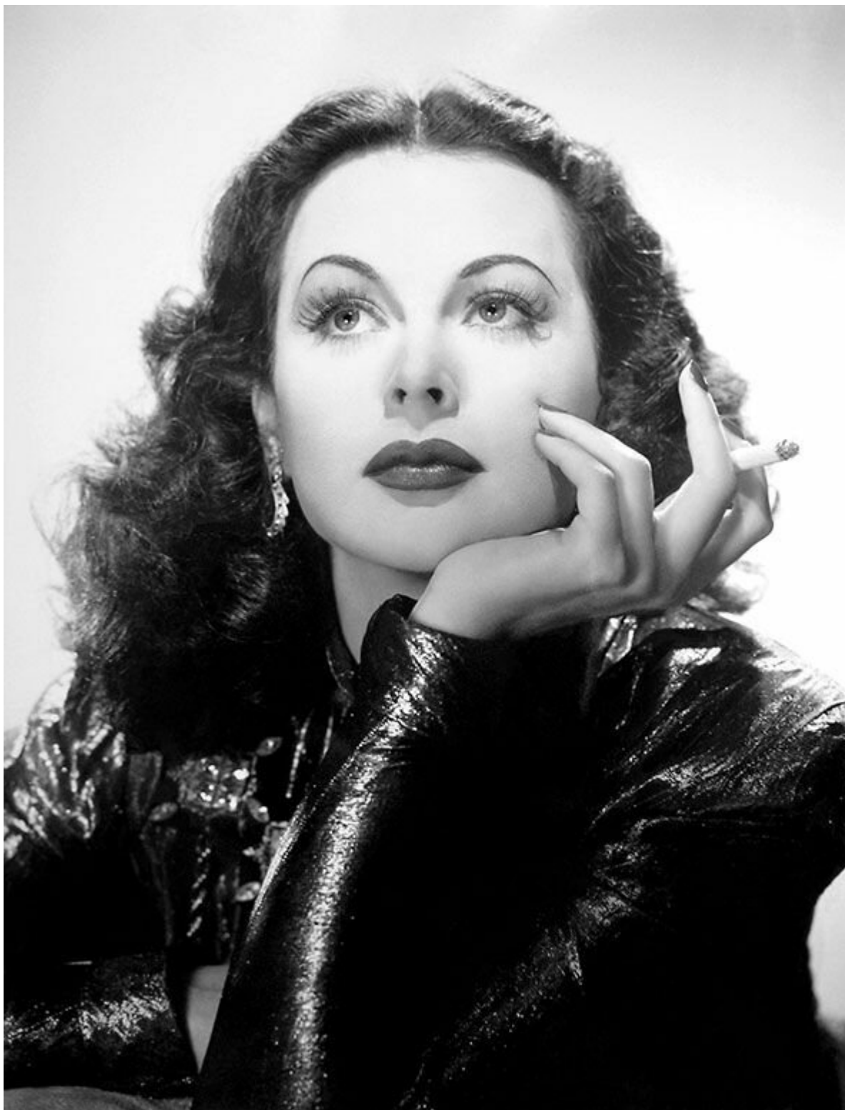
Д. Харрелл (George Hurrell) http://georgehurrell.com/

И как самостоятельные художественные произведения: свет, костюм, поза модели, интерьер – всё подобрано так замечательно, так живо, что любишь каждую деталью в кадре. Нет ничего лишнего, отвлекающего от Образа, безусловно созданного совместным усилием Звезды и Мастера.