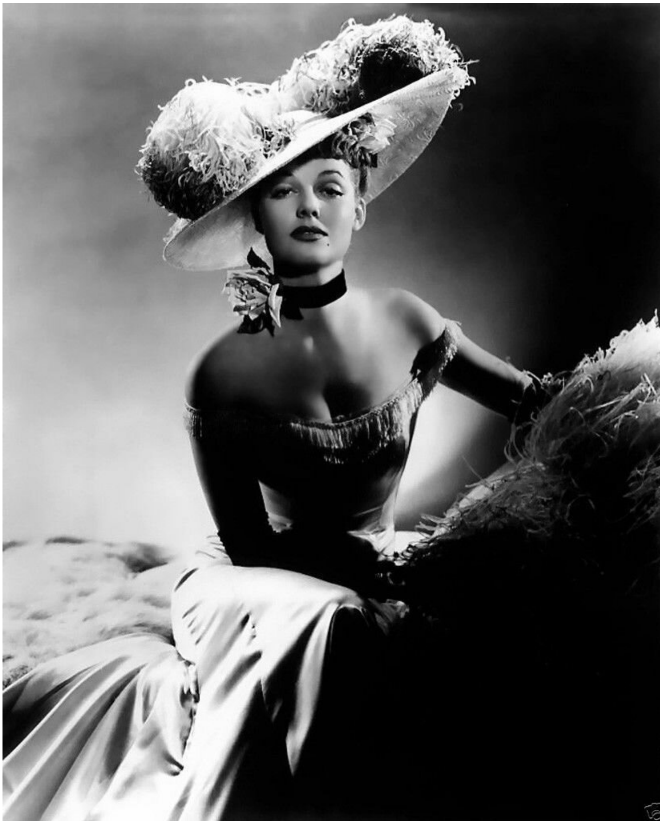
Д. Харрелл (George Hurrell) http://georgehurrell.com/

Джорджу Харреллу удалось настолько хорошо передать сексуальность Нормы Ширер, что Тальберг предложил молодому фотографу контракт со студией «Metro-Goldwyn-Mayer». Джордж стал начальником отдела портретной съемки.