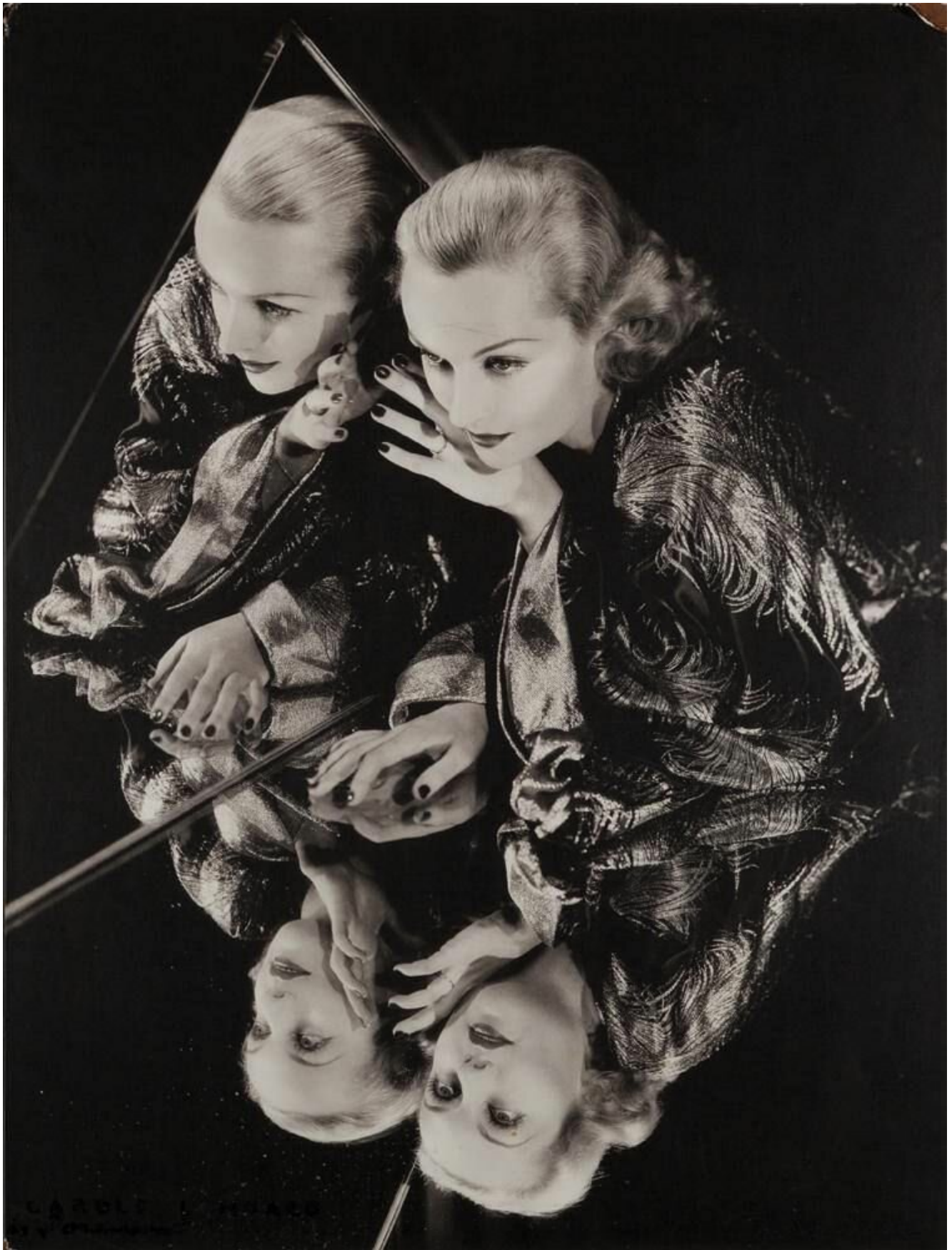
Д. Харрелл (George Hurrell) http://georgehurrell.com/