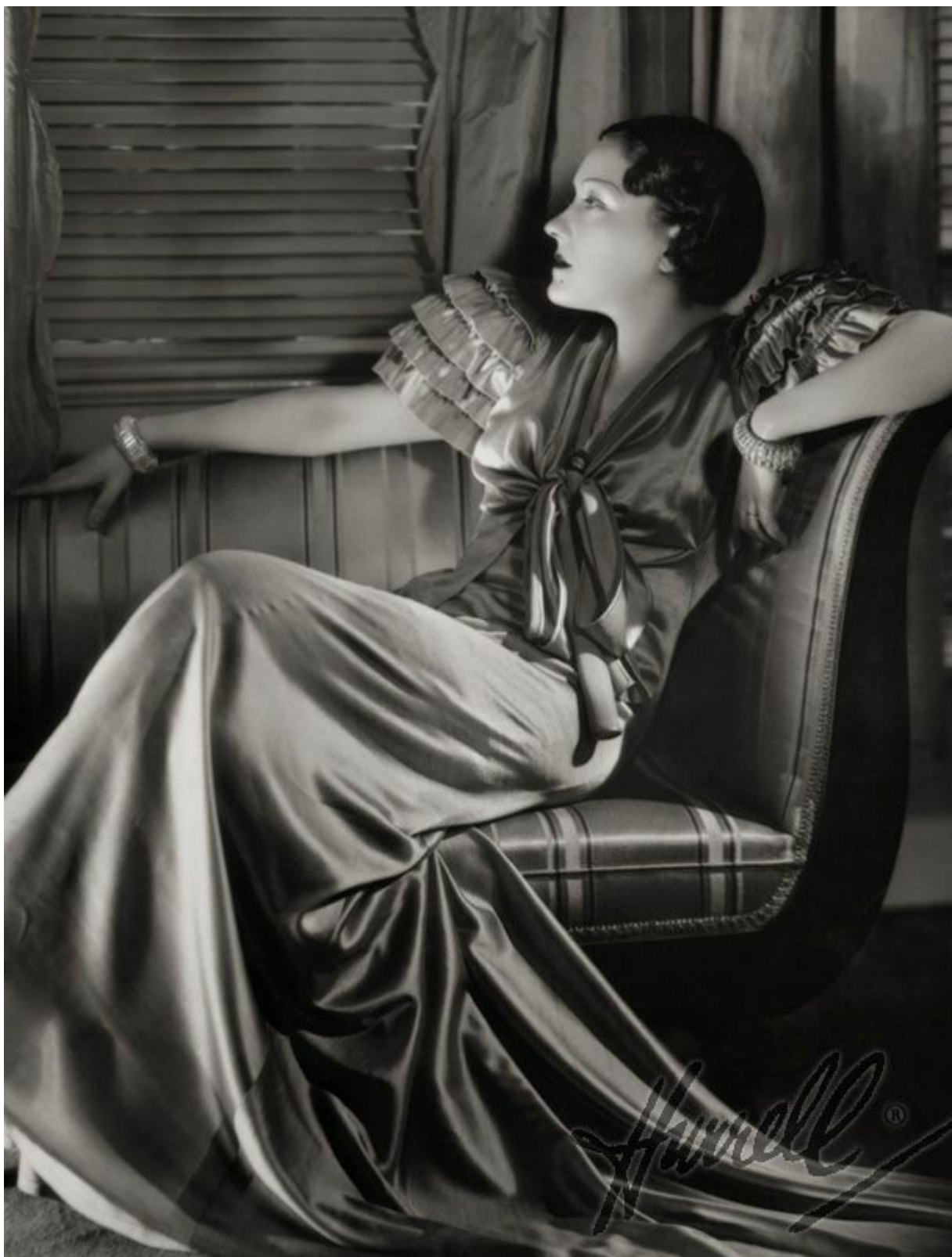
Д. Харрелл (George Hurrell) http://georgehurrell.com/

кинематограф тех лет оказал и продолжает оказывать огромное влияние на мировую культуру. С удовольствием на днях пересмотрел “Мальтийского сокола”.