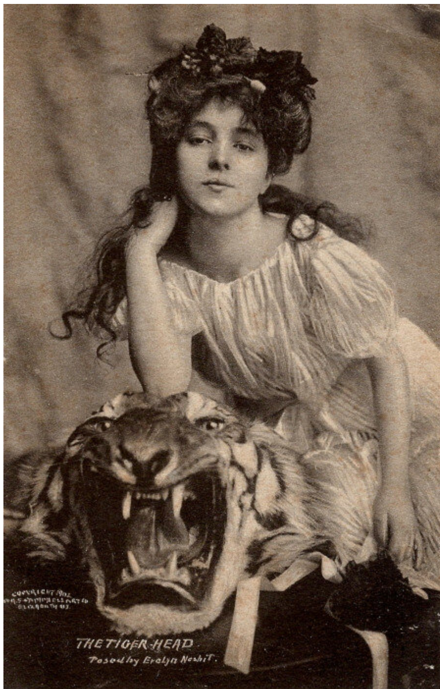
Мисс Эвелин Несбит.

актрисой, но, благодаря конкурсу, она стала популярной практически на весь мир. Ее фотографии были повсюду, начиная от модных журналов и заканчивая стойками для зонтиков.