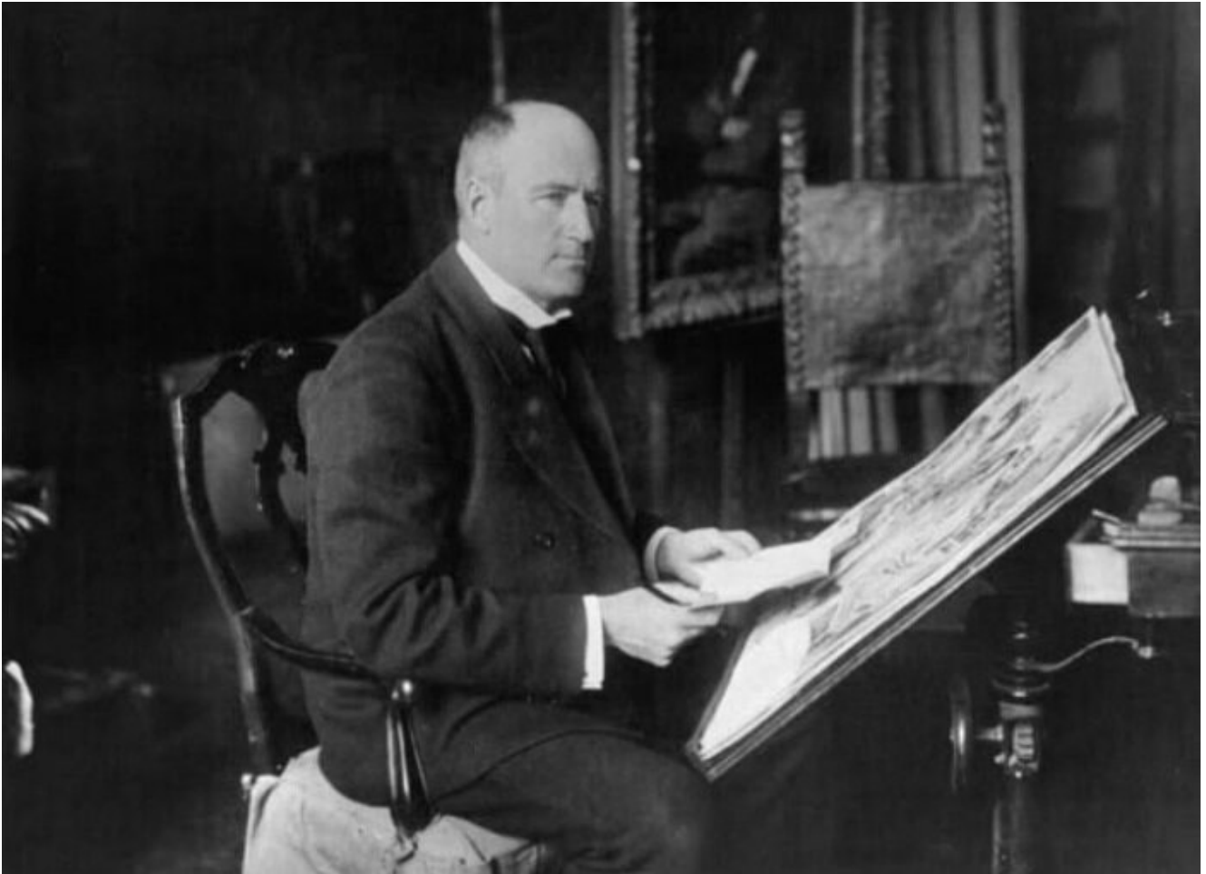
Чарльз Дана Гибсон (Charles Dana Gibson)

Чарльз Дана Гибсон (Charles Dana Gibson) – американский художник и иллюстратор, известный как создатель феномена «девушек Гибсона», представляющих собой собирательный идеал красоты на рубеже XIX–XX вв.