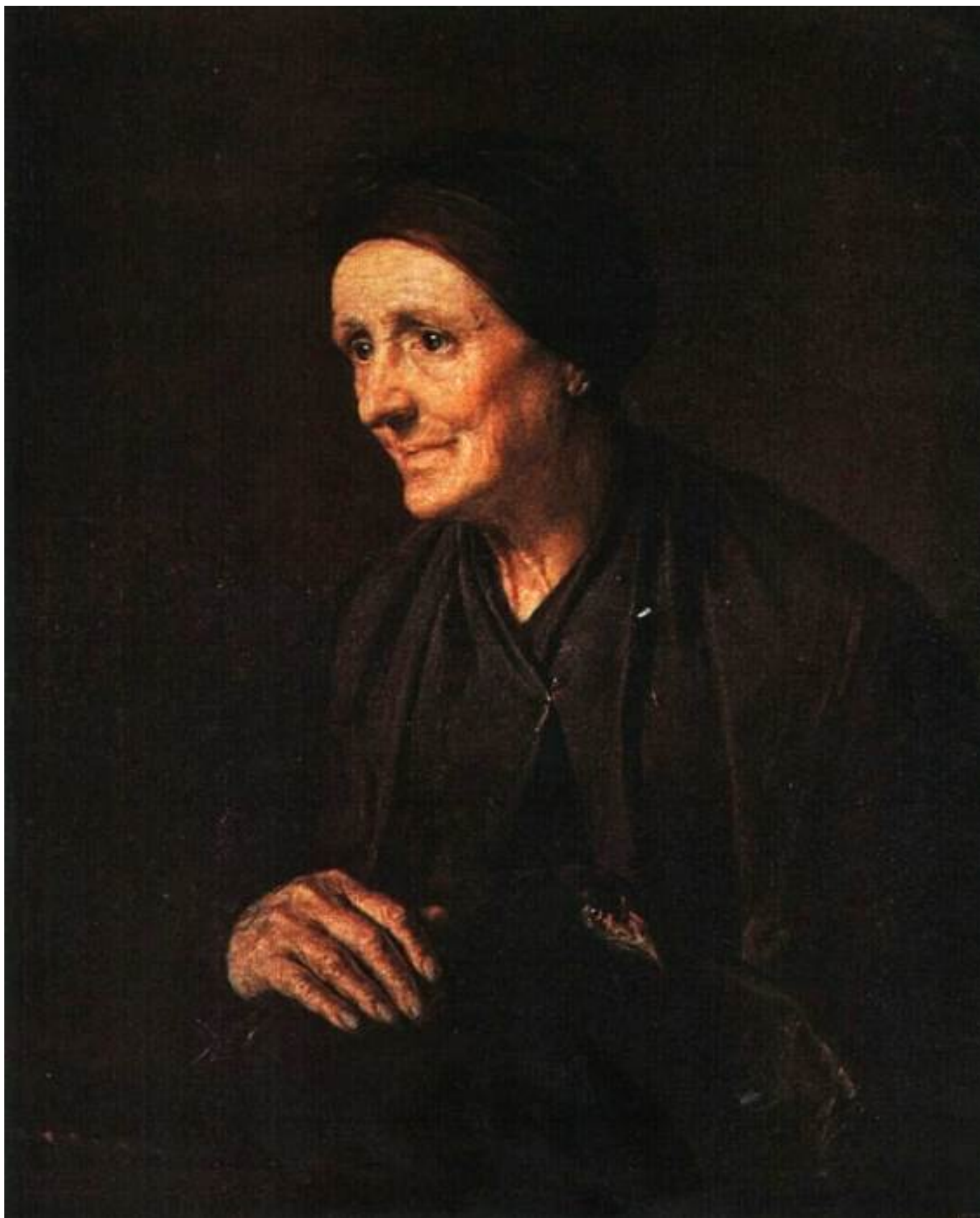
Старуха с курицей