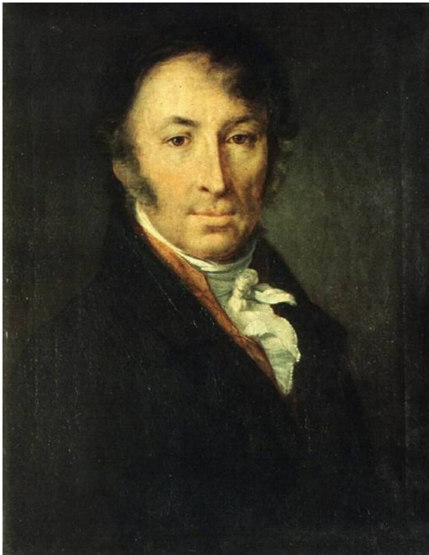
Портрет Н.М. Карамзина