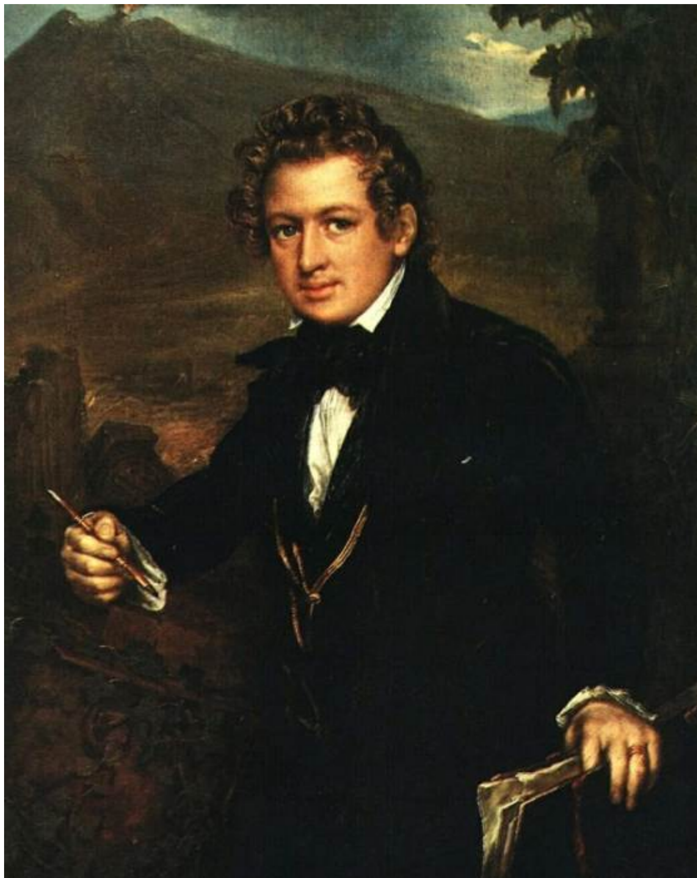
Портрет К.П. Брюллова