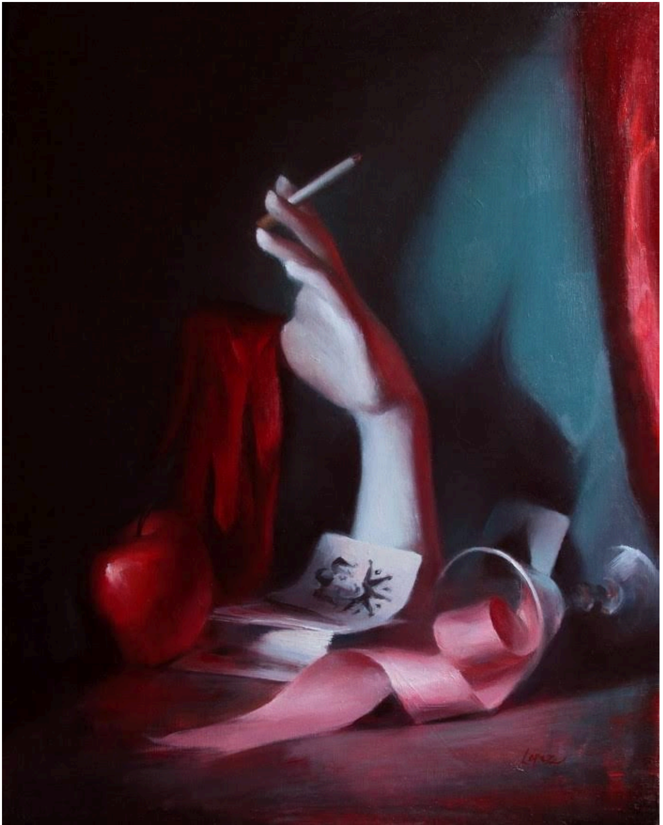
Лия Лопез. Основа.