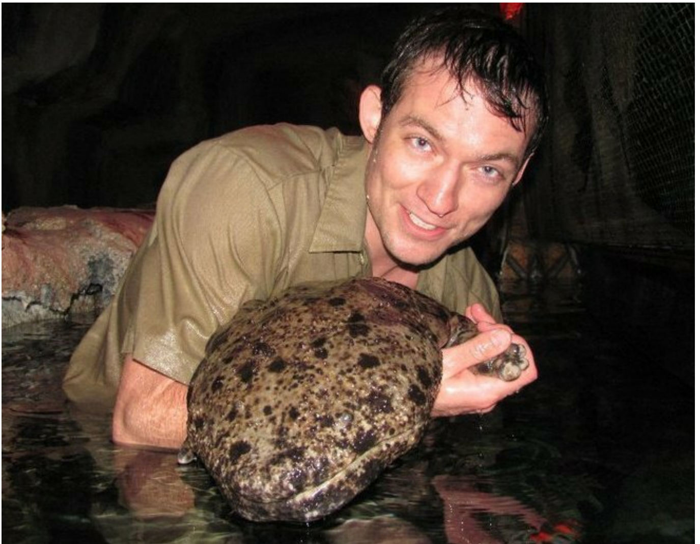
Japanese giant salamander